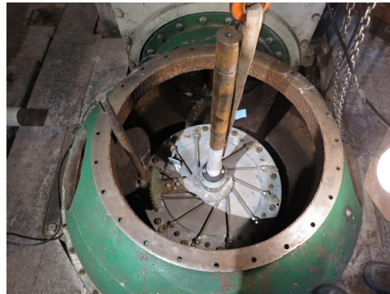
Turbinen återmonteras i turbinhuset.

Turbinen demonterades på hösten 2012. I början så försökte vi få tag på reservdelar från fabriken, som faktiskt fortfarande finns kvar i Ohio, USA. Tyvärr lyckades vi inte med det, utan vi fick själva tillverka de delar som måste bytas ut. Som vanligt när vi renoverar saker i kvarnen så försöker vi att inte byta ut mer än nödvändigt, utan att renovera och återanvända de ursprungliga delarna så långt det går. Det är därför ganska få delar i turbinen som vi har bytt ut. Det innebär att renoveringar ibland kan ta lite tid. Turbinrenoveringen har tagit 5 år.