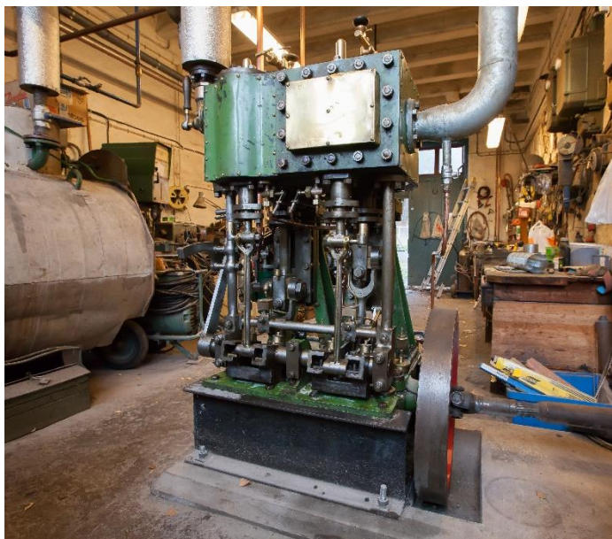
Ångmaskinen i kvarnen.

Den ångmaskin som finns i kvarnen idag är tillverkad 1922 på Djurgårdsvarvet i Stockholm. Det är en tvåcylindrig komppoundmaskin på ca 50 hästkrafter. Den är egentligen byggd för att sitta i ett fartyg, men har varit reservmaskin och legat nedmonterad i ett förråd och har aldrig suttit i något fartyg. Föreningen köpte och installerade maskinen på 90-talet.