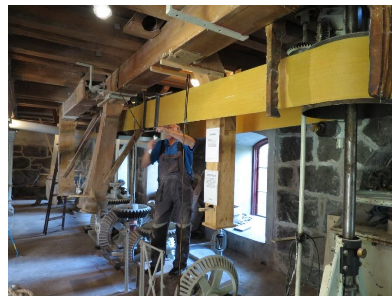
Ny drivrem till turbinen monteras.