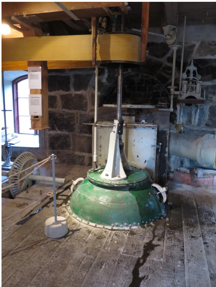
Turbinen under provkörning 4 november.

Turbinen demonterades på hösten 2012. I början så försökte vi få tag på reservdelar från fabriken, som faktiskt fortfarande finns kvar i Ohio, USA. Tyvärr lyckades vi inte med det, utan vi fick själva tillverka de delar som måste bytas ut. Som vanligt när vi renoverar saker i kvarnen så försöker vi att inte byta ut mer än nödvändigt, utan att renovera och återanvända de ursprungliga delarna så långt det går. Det är därför ganska få delar i turbinen som vi har bytt ut. Det innebär att renoveringar ibland kan ta lite tid. Turbinrenoveringen har tagit 5 år.